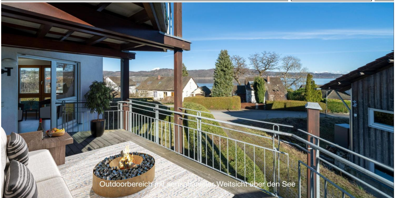
Outdoorbereich mit sensationeller Weitsicht über den See