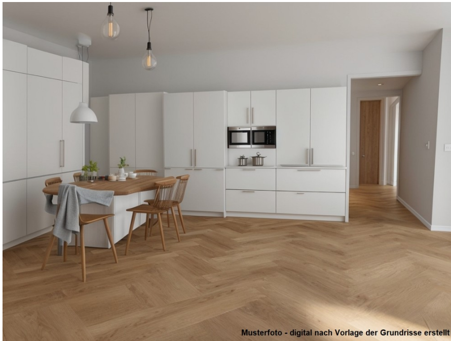
Musterfoto - digital nach Vorlage der Grundrisse erstellt