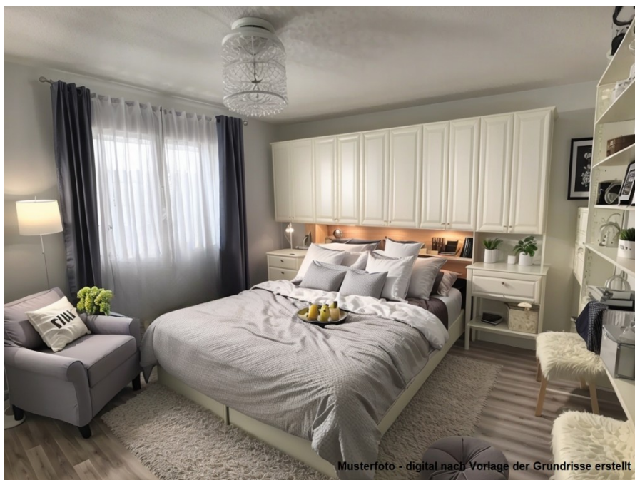
Musterfoto - digital nach Vorlage der Grundrisse erstellt