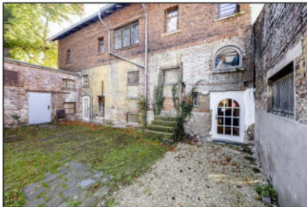
Gemeinsamer Innenhof zur Bruchstraße 4