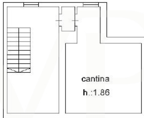
PIANO 1 SOTTOSTRADA

Dieser Grundriss ist nicht maßstabsgetreu. Die Unterlagen wurden uns vom Auftraggeber zur Verfügung gestellt. Aus diesem Grund können wir nicht für die Richtigkeit der Angaben garantieren.