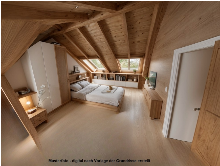
Musterfoto - digital nach Vorlage der Grundrisse erstellt