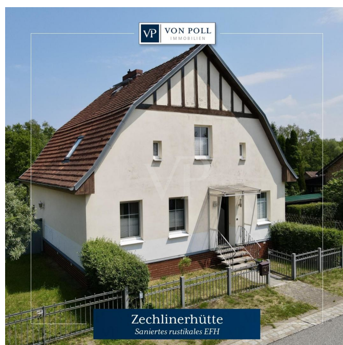
Zechlinerhütte Saniertes rustikales EFH