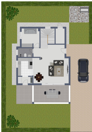
Exposplan, nicht maßstäblich