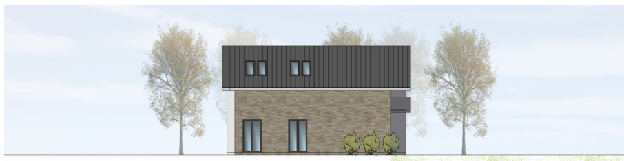
ANSICHT VON NORDEN | M100