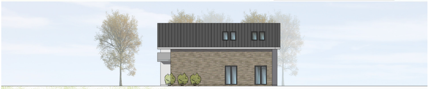
ANSICHT VON SÜDEN | M100