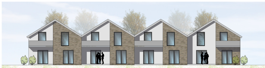
ANSICHT VON WESTEN | M100