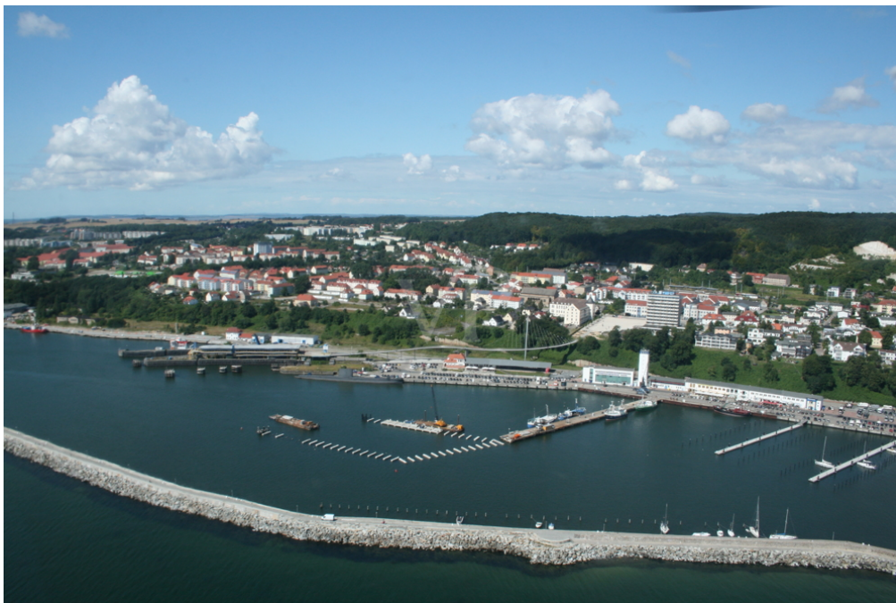
Neubau Apartment Hotel