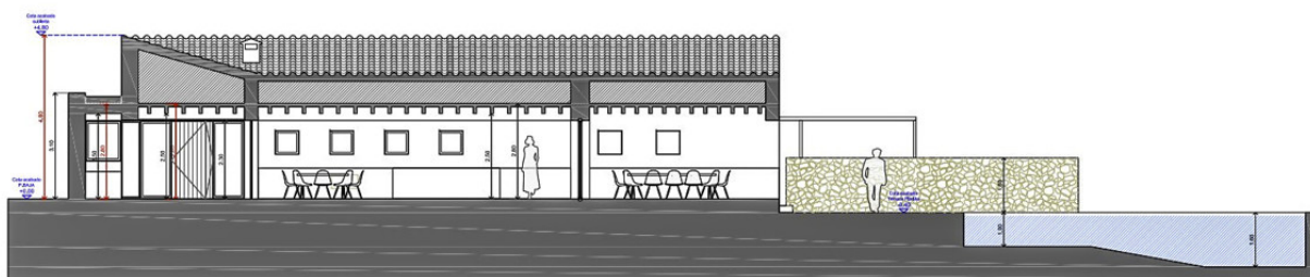
SECCIÓN 1 E: 1/50