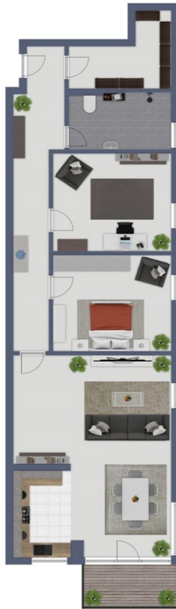
Exposéplan, nicht maßstäblich

Ez az alaprajz nem méretarányos. A dokumentumokat a megbízó adta át a részünkre. Az adatok helyességéért nem vállalunk felelősséget.