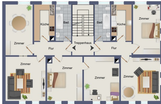
3. + 4. Obergeschoss