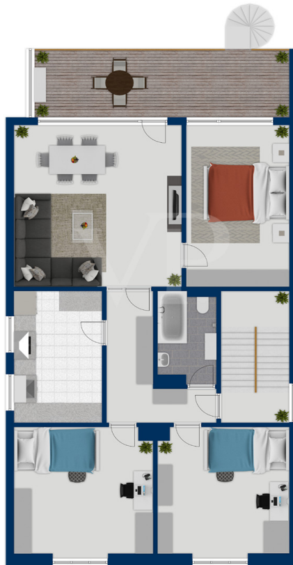
Exposéplan, nicht maßstäblich