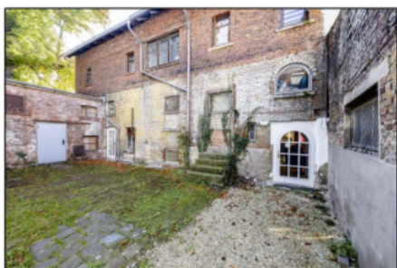
Gemeinsamer Innenhof zur Bruchstraße 4