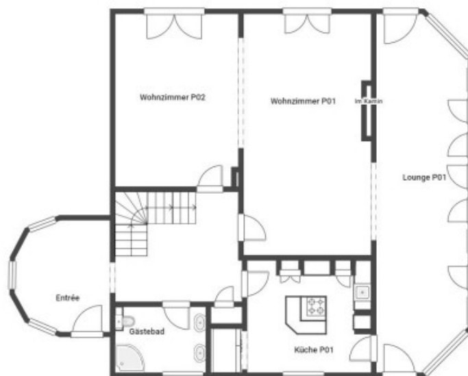
Erdgeschoss inkl. Atelier