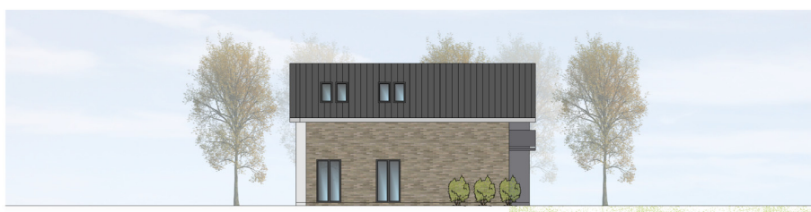
ANSICHT VON NORDEN | M100